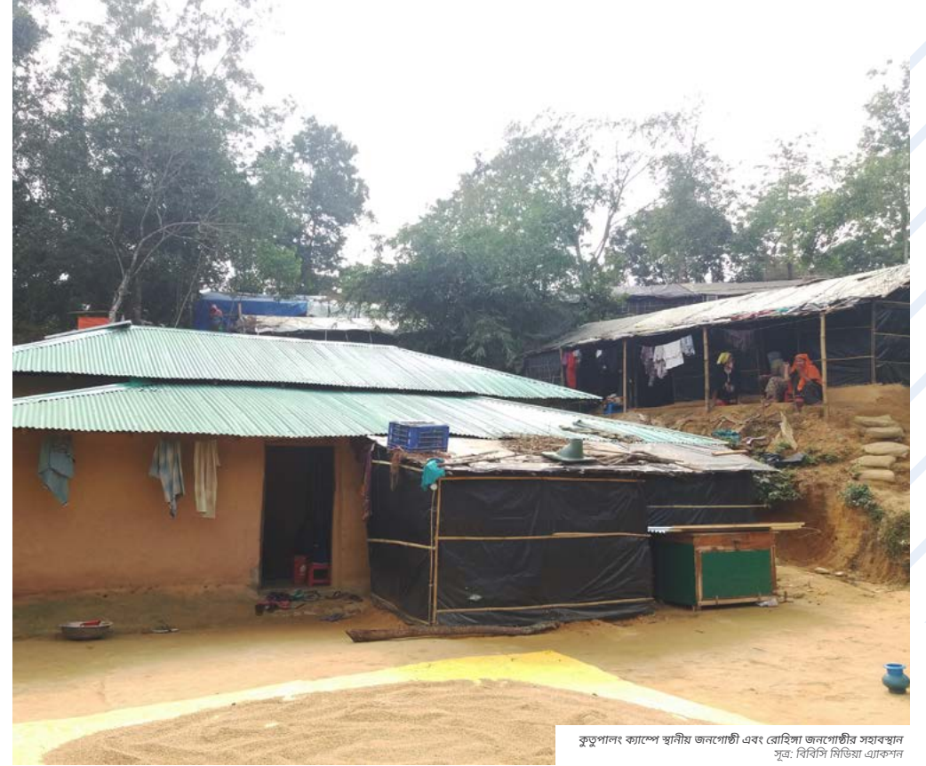
কুতুপালং ক্যাম্পে স্থানীয় জনগোষ্ঠী এবং রোহিঙ্গা জনগোষ্ঠীর সহাবস্থান

অন্যান্য যে সমস্যাগুলি সম্পর্কে জানানো হয়েছে সেগুলোর মধ্যে রয়েছে, অগণিত রোহিঙ্গা অনুপ্রবেশের ফলে মানুষজনের জমি হারানো, এর মধ্যে কৃষিভূমিও রয়েছে। শিক্ষাও আশঙ্কার একটি প্রধান বিষয়: স্কুলছুট ছাত্রছাত্রীদের সংখ্যা বৃদ্ধি পেয়েছে কারণ এখন অনেক ছাত্রছাত্রীই স্কুলে যাওয়ার পরিবর্তে ক্যাম্পের এলাকার মধ্যে ও তার আশেপাশে কাজ করা শুরু করেছে। বহু অস্থায়ী শিক্ষক কাজ ছেড়ে বিভিন্ন ত্রাণ সংস্থার সাথে কাজ করছেন। এমনকি, এই সংকটে যে বিভিন্ন সংস্থাগুলি সহায়তা দিচ্ছেন তারা কিছু শিক্ষা প্রতিষ্ঠানের বিল্ডিংও ব্যবহার করছেন যার ফলে ছাত্রছাত্রীরা সেখানে যেতে পারছে না। কিছু বাবা-মা তাদের স্কুল পড়ুয়া সন্তানদের নিরাপত্তা নিয়ে উদ্বেগ কারণ রাস্তায় যানবাহনের সংখ্যা খুব বেশি বেড়ে গেছে এবং রাস্তার কাছাকাছি এলাকায় ভিড় খুব বেশি থাকে।